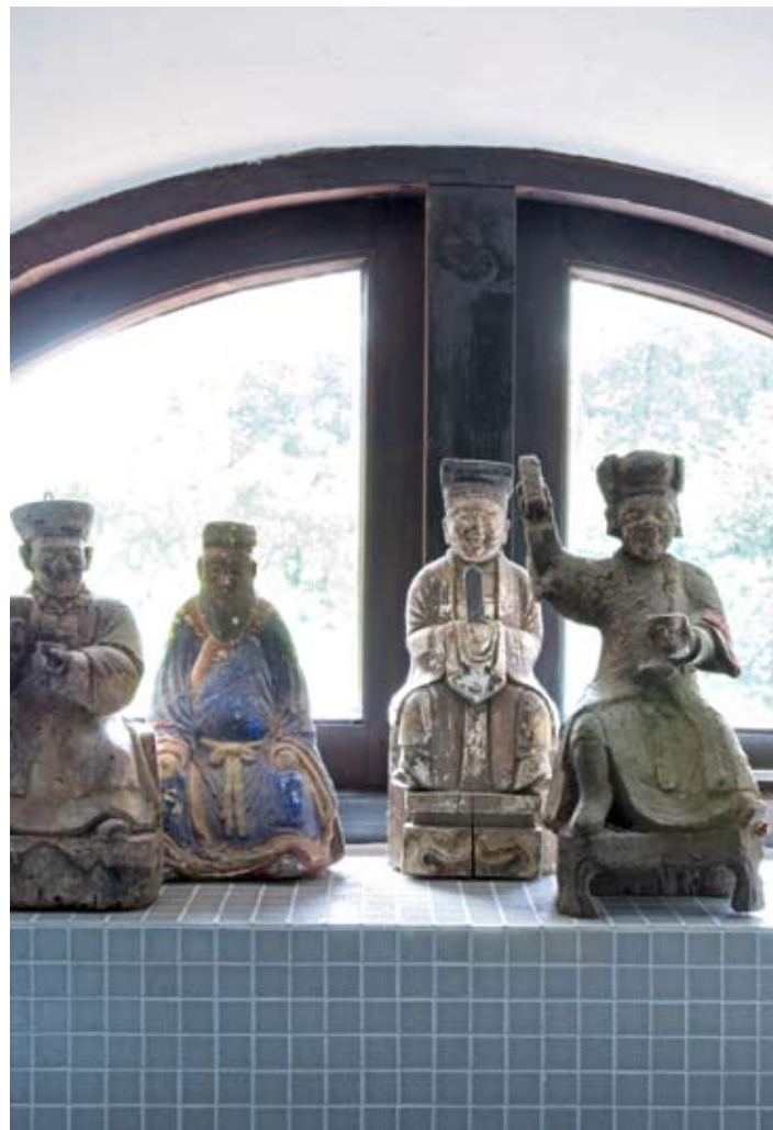
Linksboven In de slaapkamer staan bed Marettimo van Flou en antieke Chinese kastjes. De schilderijen zijn van Christine Lecoq. Rechtsboven De Chinese beeldjes dragen, verstopst in hun rug, een gebedbriefje. In de badkamer hebben ze hun eigen hoek. Links- en rechtsonder De badkamer onder de schuine kap. Het bad ligt verscholen achter de muurtjes. Rechterpagina Een poort vormt de toegang tot het woonhuis.